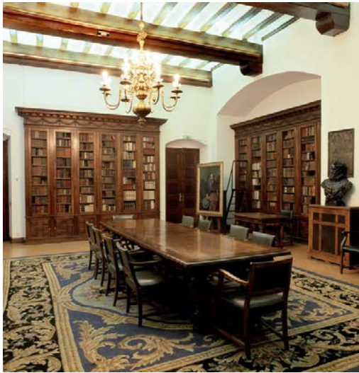
Sala Cervantina de la Biblioteca de Catalunya

L'origen d'aquesta col·lecció va ser la donació de 3.367 peces feta pel bibliòfil Isidre Bonsoms, que ingressava el 1915 a l'antiga sala blava del Palau de la Generalitat, on era ubicada inicialment la Biblioteca de Catalunya. El 1936 s'instal·là a l'emplaçament actual amb el mobiliari d'origen. El retrat a l'oli d'Isidre Bonsoms, de José María Vidal-Quadras i el bust en bronze de Cervantes de Josep Reynés acompanyen la col·lecció.