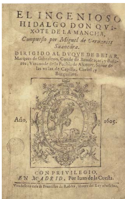
Primera edició de la primera part. Madrid: Juan de la Cuesta, 1605.

El conjunt cervantí de la Biblioteca és d'una qualitat extraordinària i és considerada una de les millors col·leccions públiques del món.