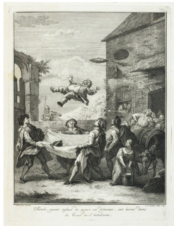
"El manto de Sancho", il·lustrat per Coypel.