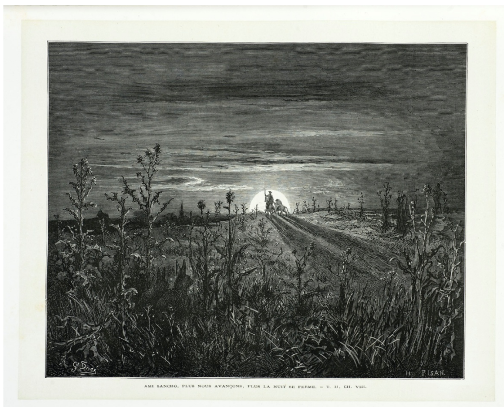
El Quixot i Sancho fent camí al capvespre. Il·lustració de Doré. Paris: Libr. de L. Hachette et Cie, 1863.