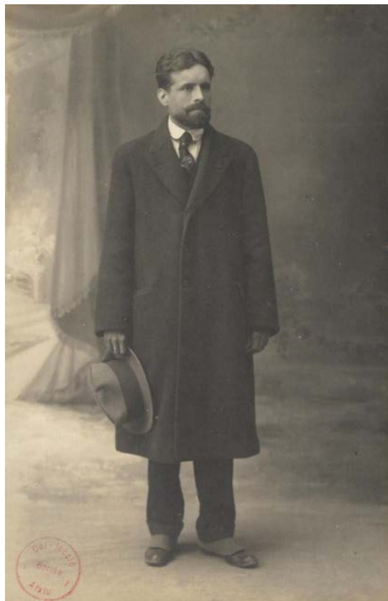
Il·lustració 2: Retrat als 33 anys. 1919