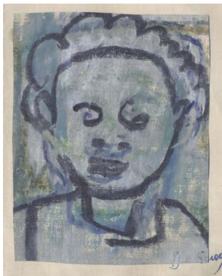
Il·lustració 4: Fellicitació. Detall 1959