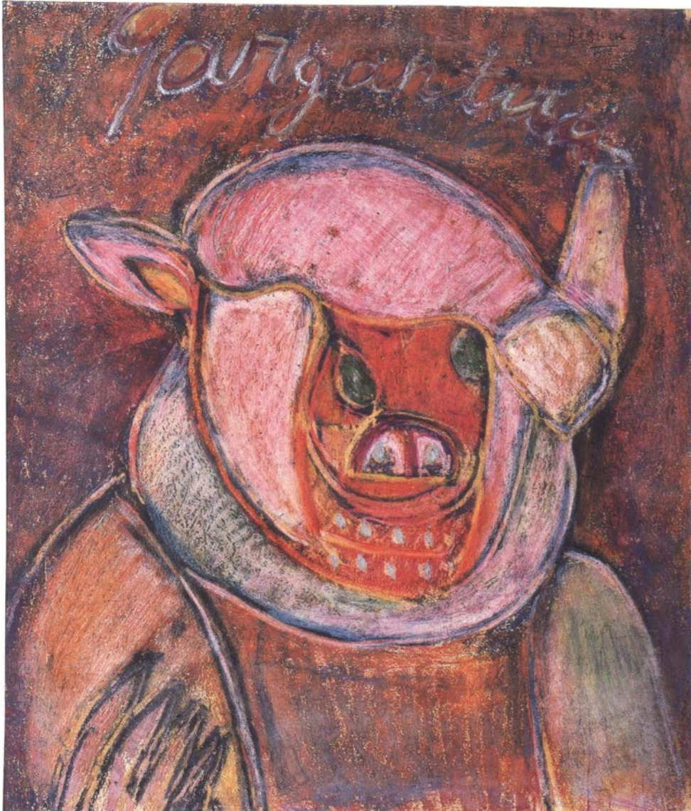
Il·lustració 5: Gargantua. MACBA