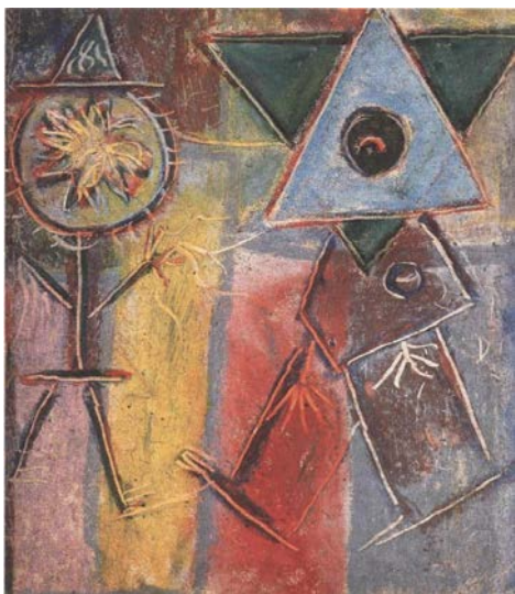
Il·lustració 3: Composició. MACBA