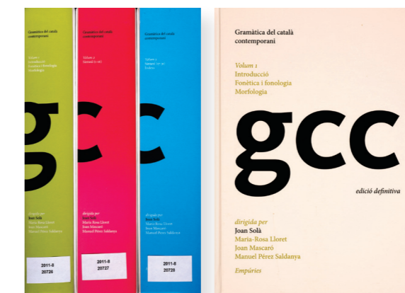
Joan Solà et. al. (dir.). Gramàtica del català contemporani . Barcelona : Empúries, 2002. 3 vol. 4ª ed. definitiva. Barcelona : Empúries, 2008

Per altra part, en un context de represa de l'ús institucional del català amb la recuperació de les institucions democràtiques, també va contribuir al foment del bon ús de la llengua a través de la redacció de manuals per a escriure i publicar de manera correcta i de tasques d'assessorament a mitjans de comunicació, a campanyes d'ensenyament del català, a propostes legislatives, etc.