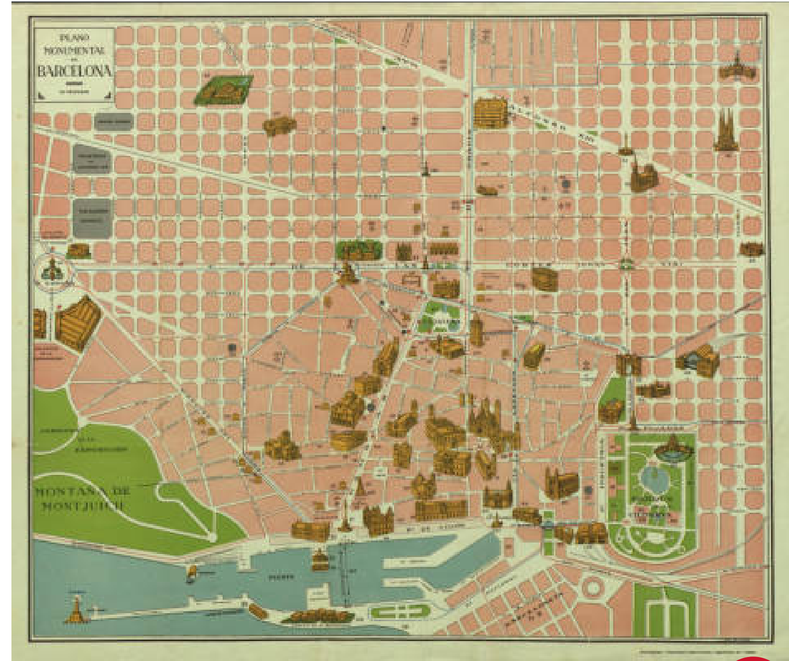
FM. Ponz (grav.), Plano monumental de Barcelona , 193?

Com a docent, la teva funció serà acompanyar aquest procés: facilitar la lectura dels materials, dinamitzar els debats i orientar la creació de les noves mirades sobre la ciutat . En les pàgines següents trobaràs tot el que necessites per preparar i conduir el taller amb seguretat i les orientacions que t'ajudaran a guiar l'alumnat al llarg d'aquest viatge.