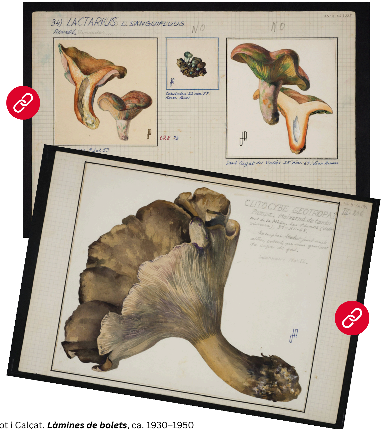
Josep Ribot i Calçat, Làmines de bolets , ca. 1930–1950

Prepara't per guiar-los en un viatge en què cada làmina, paraula i traç es converteix en una porta oberta al coneixement i a la creativitat .