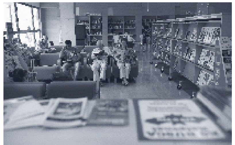
Biblioteca Marcel·lí Domingo (Tortosa).

La celebració de l'Any de les Biblioteques ha volgut posar en el punt de mira aquests equipaments extraordinaris tant estimats però encara no prou valorats.