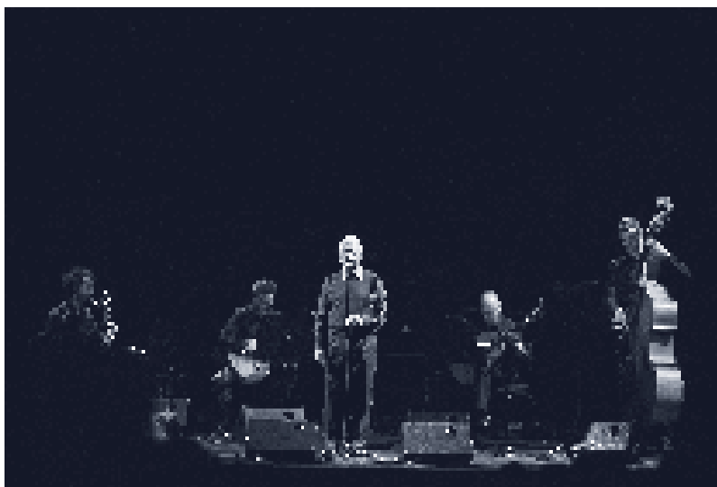
Concert de cloenda de 2015 Any de les biblioteques, al Liceu.