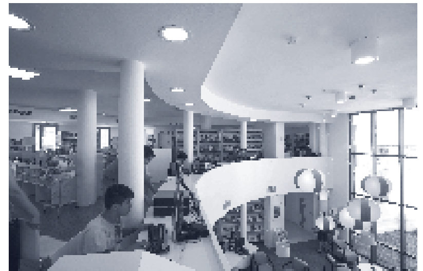
Biblioteca Trinitari Fabregat (Alcanar).

Pel que fa als carnets, cal dir que són vàlids a totes les biblioteques: hi ha reconeixement però no base de dades única. Durant el 2015, s'ha treballat en el procés de reconeixement d'un carnet amb imatge única que permetrà unificar les propostes i els avantatges dels dos carnets existents actualment. La finalitat és que els usuaris puguin accedir als serveis de totes les biblioteques públiques sigui quin sigui el municipi on estigui donat d'alta i, alhora, es beneficiï amb el carnet únic dels mateixos avantatges i descomptes culturals. Aquest és, doncs, un pas important cap a la consecució del carnet cultural, un dels objectius estratègics del govern de la Generalitat.