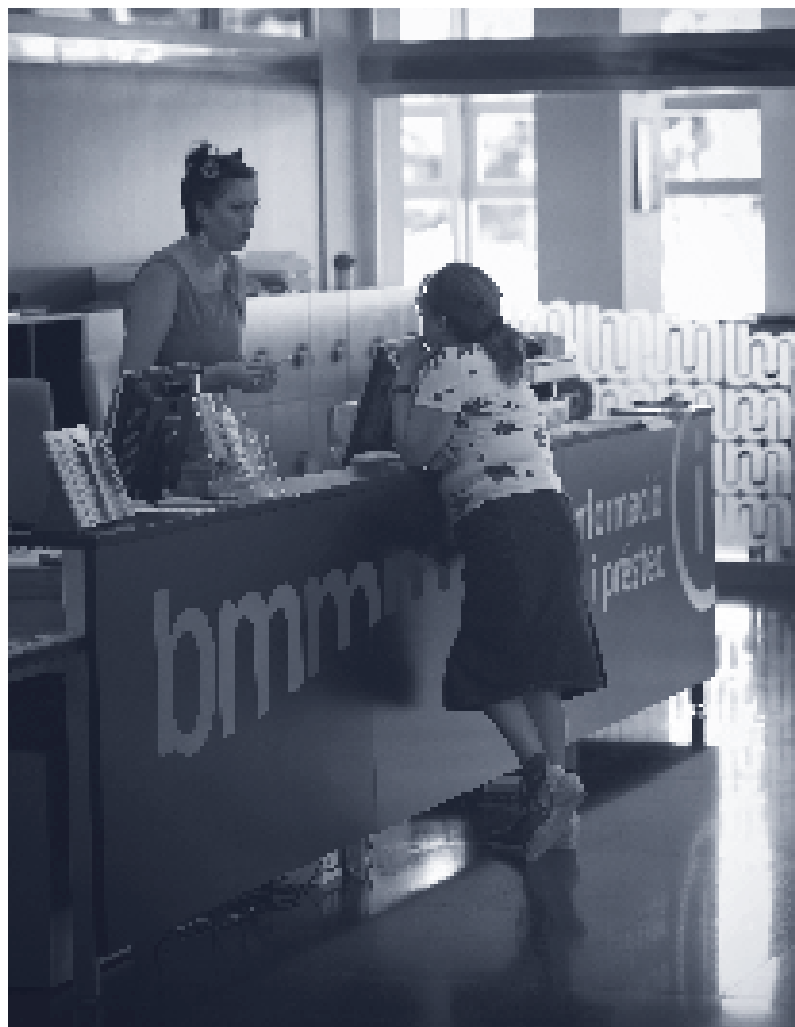
Biblioteca Municipal Marta Mata (Cunit).

Borges Blanques: desembre, a la Biblioteca Marquès d'Olivart