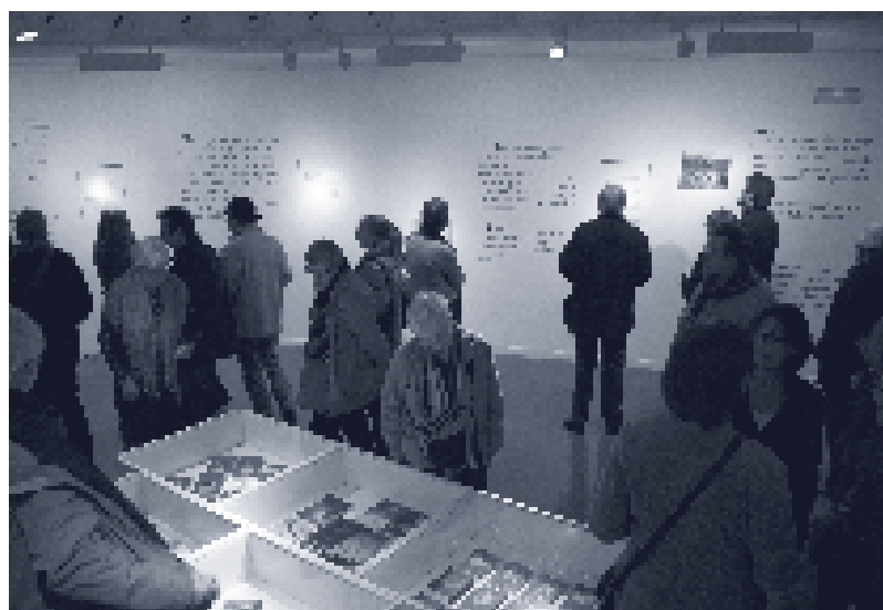
Biblioteca Jaume Fuster (Barcelona).

A dia d'avui, la introducció del servei de préstec de llibre digital és un objectiu plenament aconseguit gràcies a la voluntat de cooperació i coordinació entre la Diputació de Barcelona, l'Ajuntament de Barcelona i la Generalitat de Catalunya . A la plataforma e-Biblio, a més dels 2.200 llibres electrònics disponibles, a partir del mes de gener de 2016, s'han incorporat les principals revistes que es publiquen en català, gràcies a l'acord entre el Servei de Biblioteques de la Generalitat i l'Associació de Publicacions Periòdiques en Català (APPEC). Aquesta oferta de revistes s'anirà ampliant progressivament de la mà d'un increment significatiu del catàleg de llibres, així com la incorporació de continguts audiovisuals.