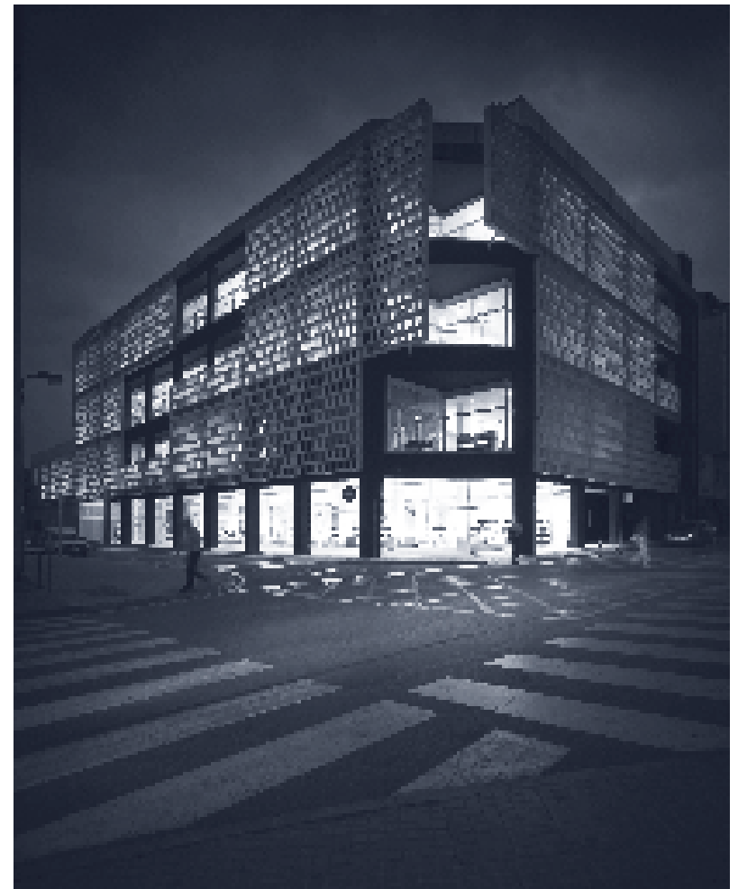
Biblioteca Mestre Martí Tauler (Rubí).

Cada vegada volem tenir més informació a l'abast i d'una manera més ràpida. Un debat seriós sobre l'accés a la informació requereix, com a mínim, una predisposició a revisar models des d'una mirada àmplia d'una realitat canviant i plena d'incerteses. Els temps convulsos en què vivim -tant a nivell social, com pel que ha suposat el ràpid avenç de les noves tecnologies de la comunicació i la informació- demanen una reflexió pausada. Són molts i molt variats els factors que intervenen a l'hora de trobar els millors professionals, eines i procediments per aconseguir que l'accés a la informació esdevingui una experiència realment gratificant, transformadora i determinant en la vida de les persones, tant en la seva etapa infantil com adulta.