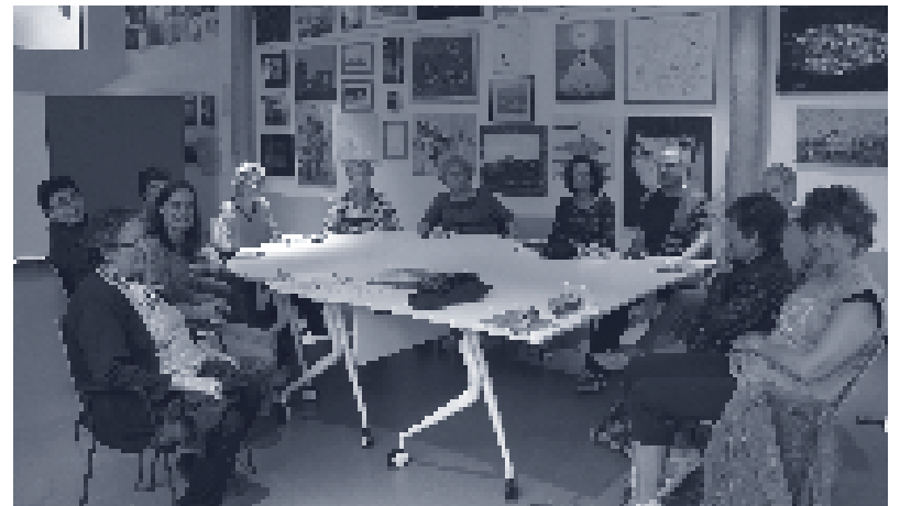
Biblioteca de Palafrugell