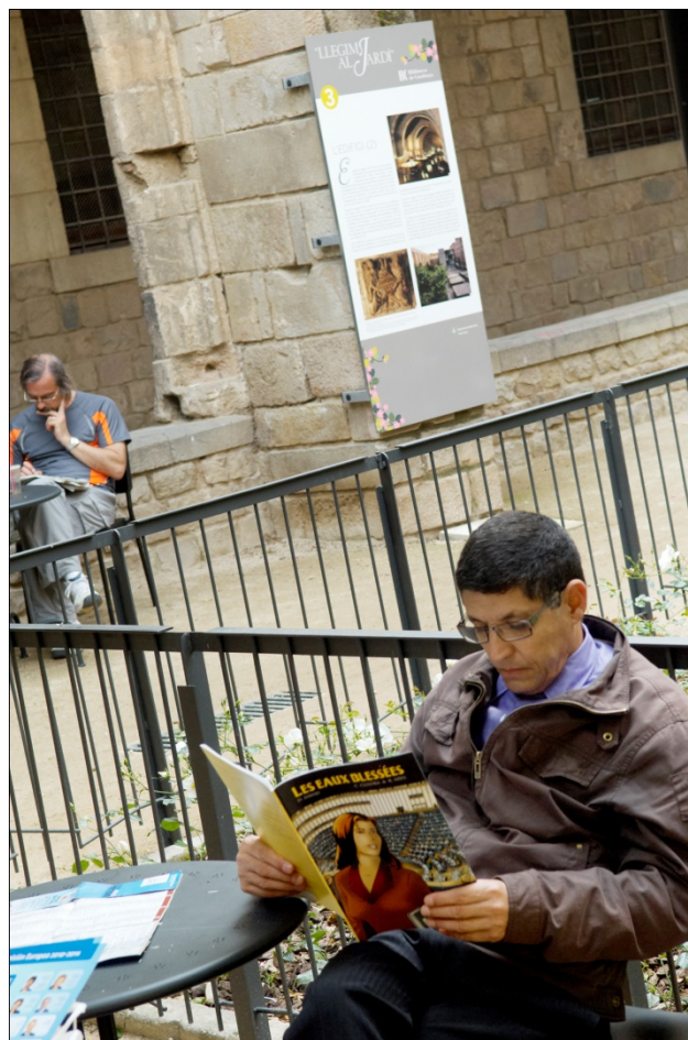
Llegim al jardí

Des del web de la Biblioteca es pot accedir, a més, a diversos serveis: informació bibliogràfica, reserva i reproducció de documents, reserva d'ordinadors portàtils a la sala de lectura, préstec interbibliotecari per a institucions i usuaris particulars, proposta de compra de documents, visites guiades i sessions de docència, obtenció i renovació de passis i carnets de lector, i distribució de documents duplicats a entitats sense ànim de lucre.