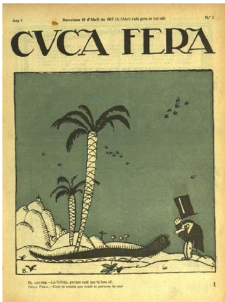
Núm. 1 de la revista Cucafera, a ARCA

En la MDC es poden trobar col·leccions digitalitzades de la Biblioteca de Catalunya d'incunables, manuscrits, llibres impresos, material gràfic, partitures, encuadernacions artístiques, cartells, fons fotogràfics, etc. Aquestes col·leccions estan obertes i s'hi estan incorporant nous documents digitalitzats.