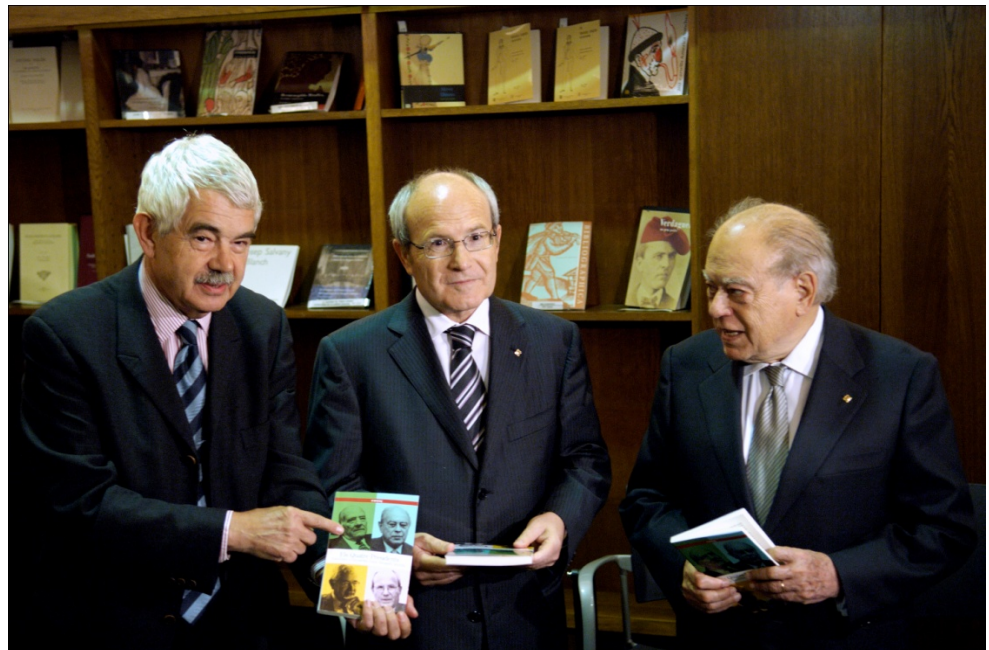
Presentació de Els quatre presidents

D'altra banda, la BC ha cedit els seus espais per a diferents activitats: rodes de premsa, congressos, reunions, etc.