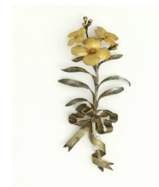
Englantina d'Or. Premio a la poesía "La sardana", ganado en los Jocs Florals de 1894

Joan Maragall y su familia se trasladaron a la casa de la calle de Alfons XII en el año 1899. La residencia, que se ha mantenido hasta nuestros días como un punto de reunión de la familia, muestra hoy un ejemplo de vivienda burguesa de la Barcelona de hace cien años.