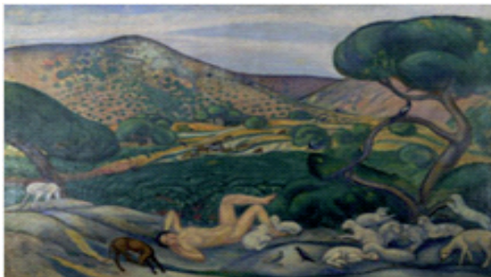
Pastoral , de Joaquim Sunyer (1911). Óleo adquirido por la familia Maragall y que forma parte de la colección artística del Arxiu.

Una completa biblioteca crítica de diferentes autores sobre la obra de Maragall, las partituras originales e impresas de más de cien músicos sobre poemas del autor, la colección iconográfica (dibujos, grabados, fotografías, cuadros, etc.) y unos 10.000 recortes de prensa completan el fondo documental del centro.