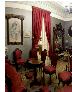
Salón noble, decorado con retratos familiares