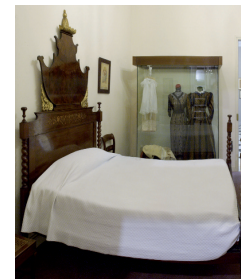
Dormitorio de estilo isabelino, mediados del siglo XIX